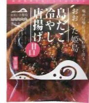
島だこ冷やし唐揚げ