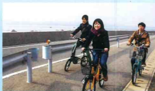
ひめしまブルーラインからの国東半島の眺望

島の南側をはる松原-大海-両瀬を結ぶ海岸道路。潮の香りと海を眺めながらのサイクリングに最適です。