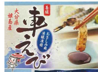
姫島車えび真空パック (おさしみ用)