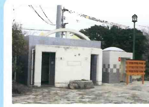
フェリー広場の公衆トイレ

姫島村名誉村民元自民党副総裁西村英一先生の顕彰碑が建立されています。揮毫は田中角栄元内閣総理大臣です。