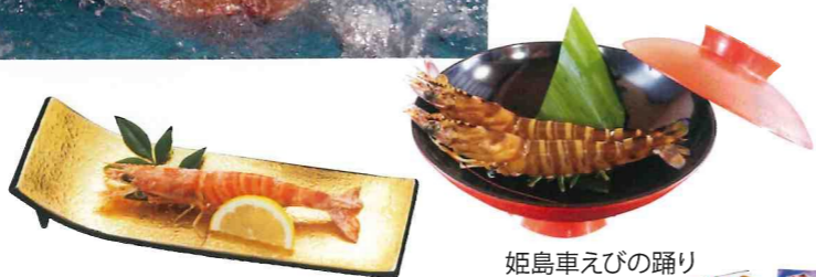
姫島車えびの塩焼き