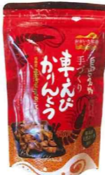
車えびかりんとう