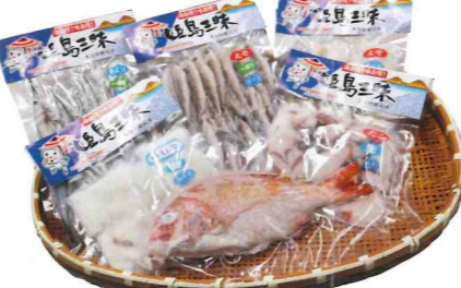
魚介類の真空パック