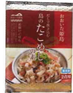
島のたこめしの素