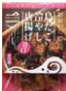
島だこ冷やし唐揚げ