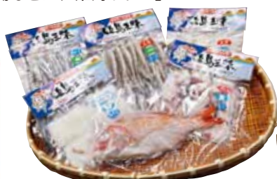
魚介類の真空パック