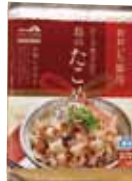
島のたこめしの素