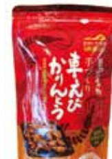
くるまエビかりんとう