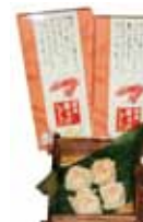
姫島車えびしゅうまい