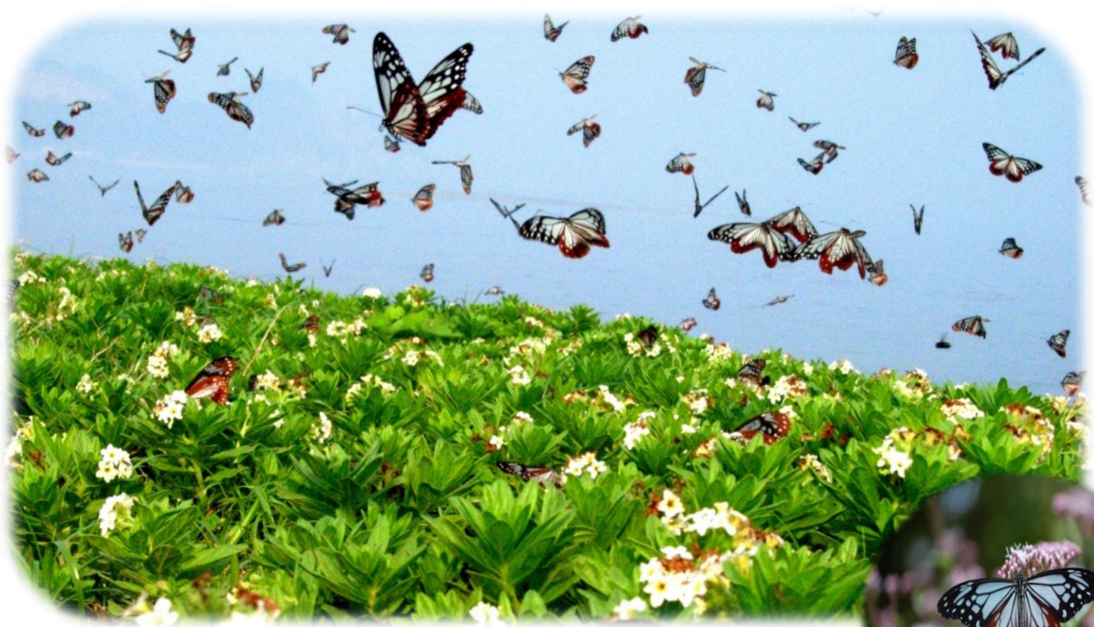
スナビキソウの上を乱舞するアサギマダラ