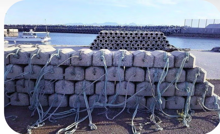
海底に沈める「たこつば」